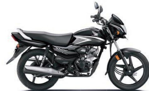
ग्रे के साथ ब्लैक

अभी ऑनलाइन बुक करें! www.honda2wheelerindia.com