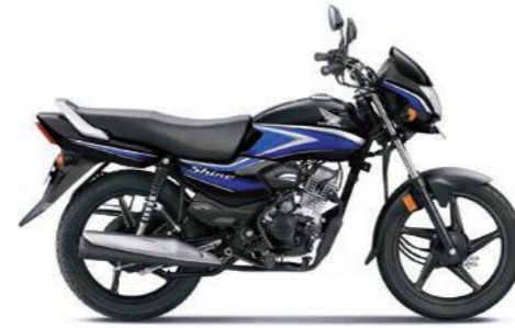
ब्लू के साथ ब्लैक