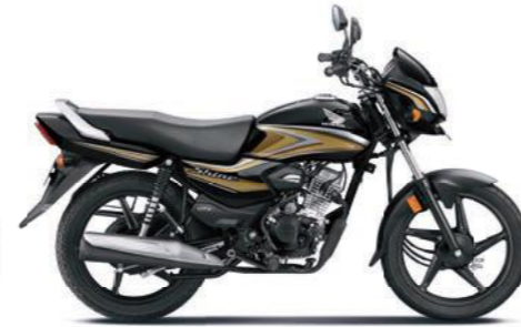
गोल्ड के साथ ब्लैक