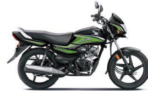
ग्रीन के साथ ब्लैक