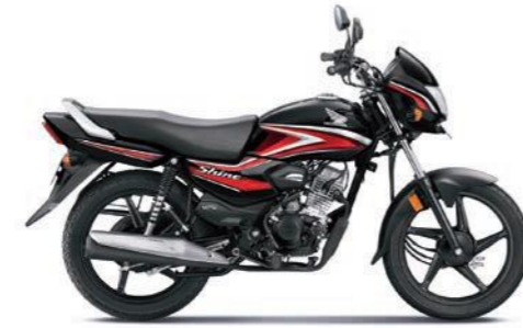
रेड के साथ ब्लैक